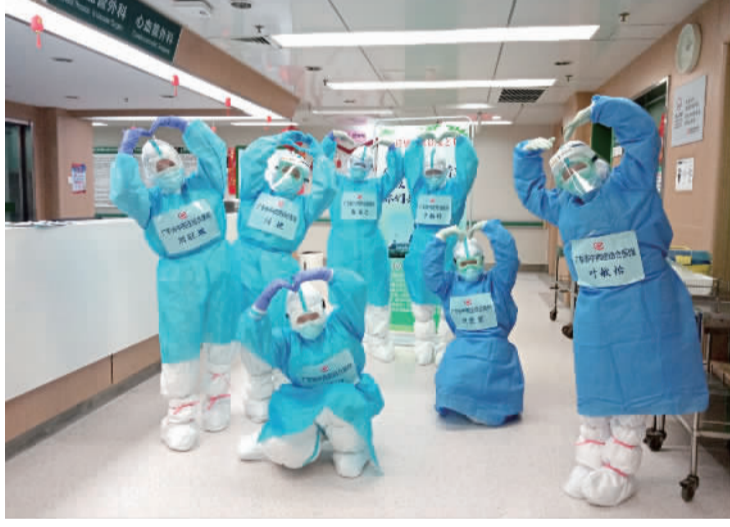
医护一起做“比心”姿势，为武汉加油。