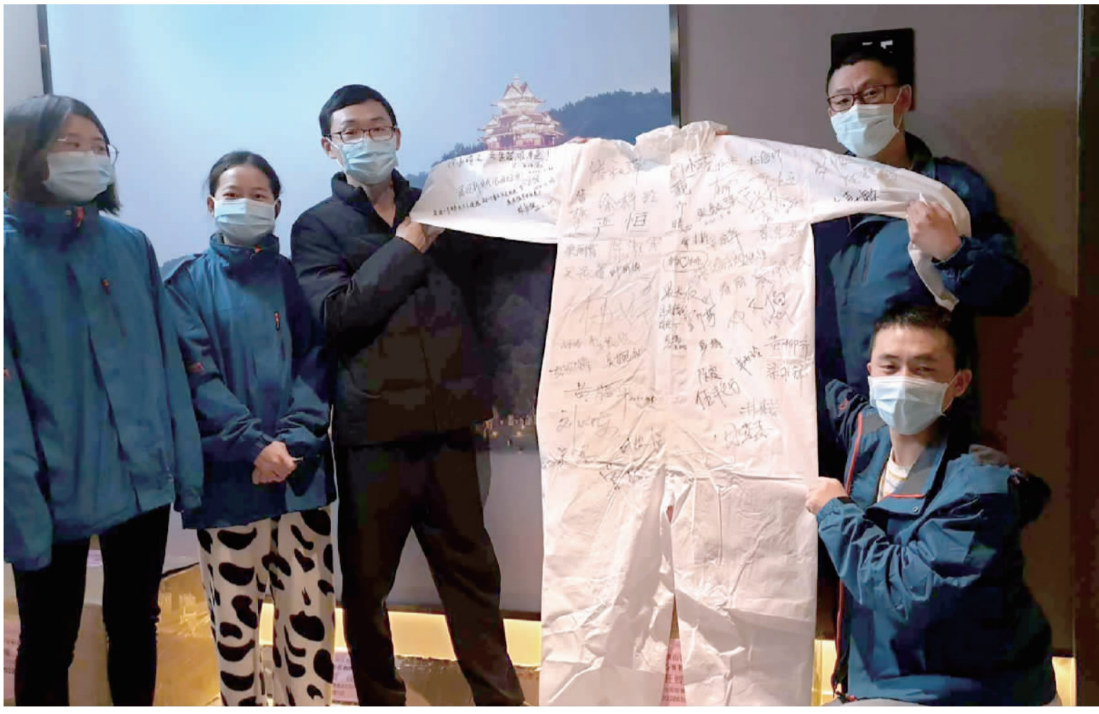
援鄂医护人员展示写满签名的白色战衣。

梅婷说，这些真实经历的抗疫故事，让她感受到并肩作战，共同抗疫的强大力量。因为大家都有共同的信念和信心：武汉必胜，中国必胜。