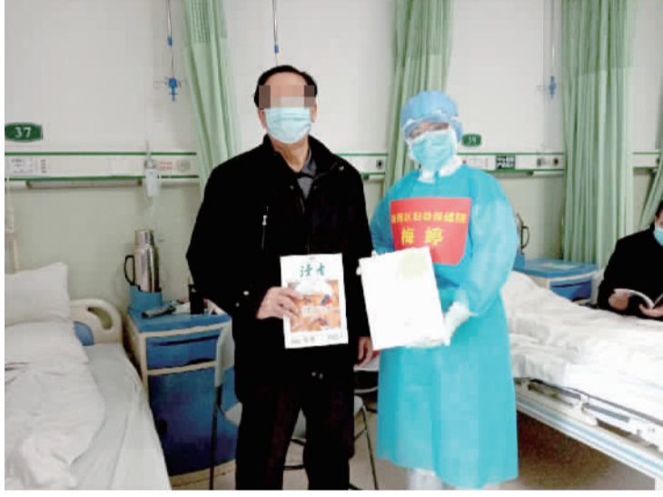
梅婷给患者送书，帮助患者舒缓心理压力，积极面对病情。