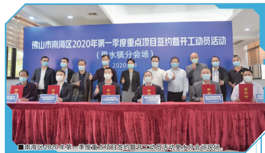
南海区2020年第一季度重点项目签约暨开工动员活动里水分会场现场。