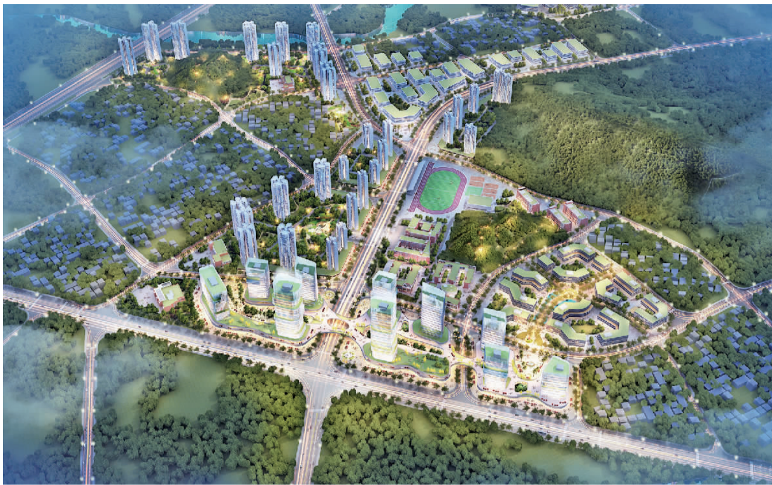
大冲千亩科技生态工业园改造项目效果图。

这两个项目将发挥工业园区资源优势，通过引入龙头企业，形成极具特色的产业集群，形成园区产业链，增强里水产业链，推动产业链企业集聚。