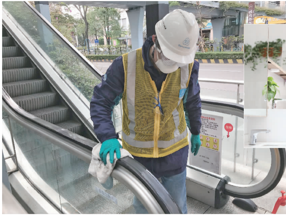
▲工作人员对千灯湖公园的公厕进行消毒。

“目前复工复产正在有序进行,未来一段时间人流量增加,公共设施清洁和消毒的频率更密。”冯伟朝说,考虑到病