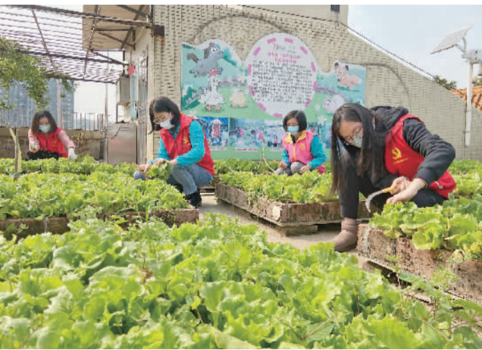
■志愿者和社工在爱心园采摘生菜。

疫岗点的南湖北区宿舍自管小组成员,以感谢他们日夜守护小区的辛劳;30名坚守岗位的环卫工人,以感谢他们对社区环境的付出。此外,志愿者还把生菜送到社区不便出门的困境长者家中。志愿者们还将第