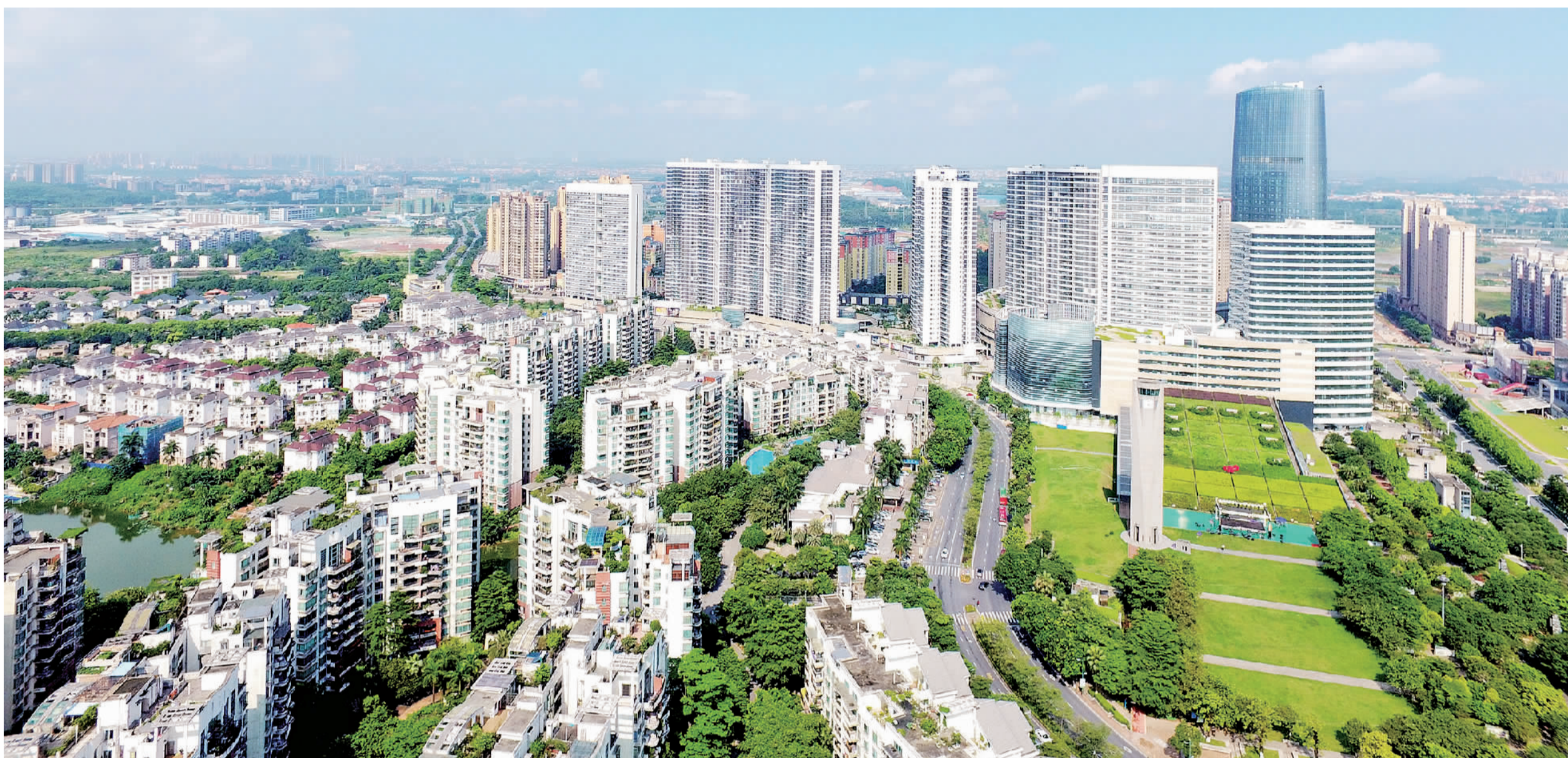
■狮山致力打造南海的产业之核、创新之核,成为粤港澳大湾区先进制造业高地,为全区高质量发展大旗。