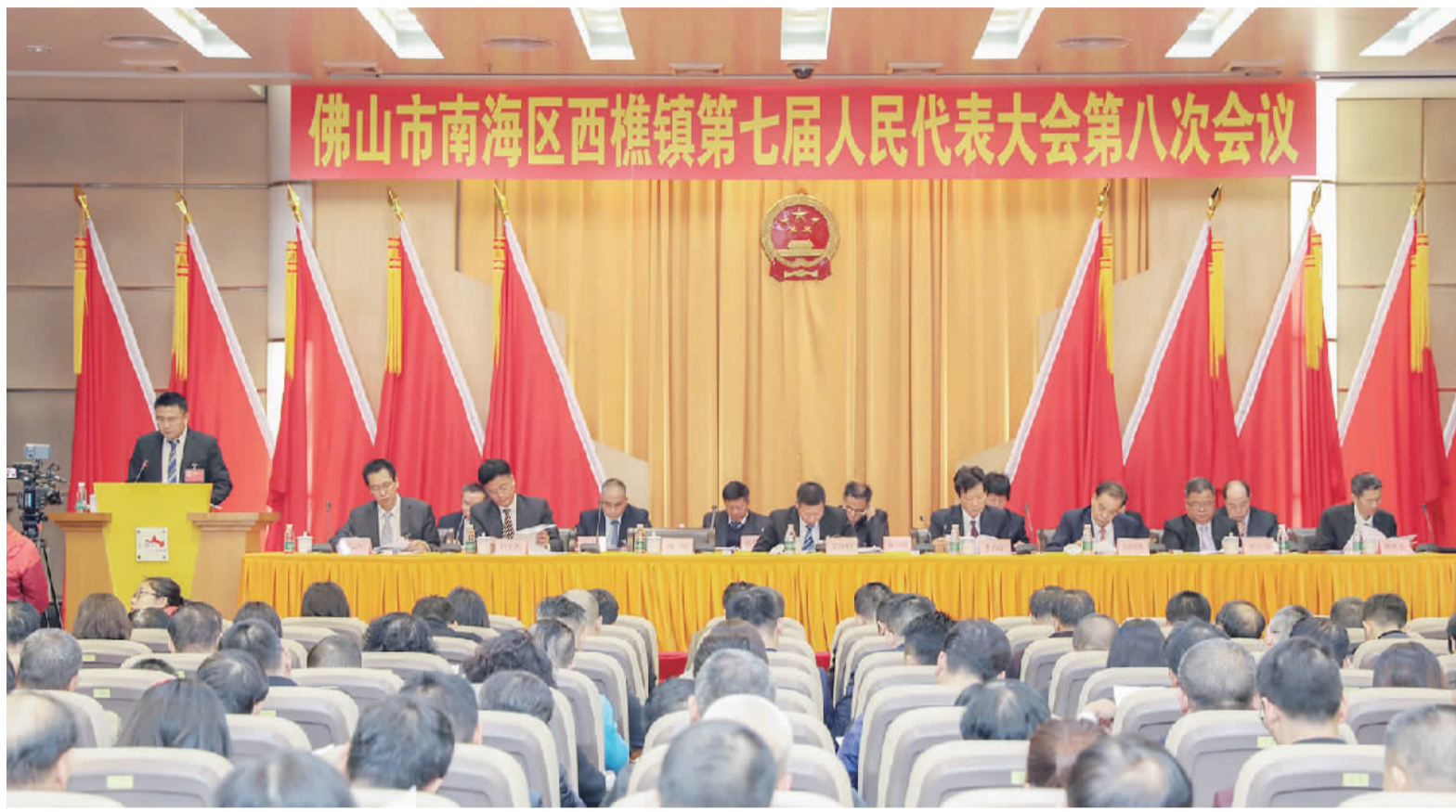
■西樵镇第七届人民代表大会第八次会议开幕。