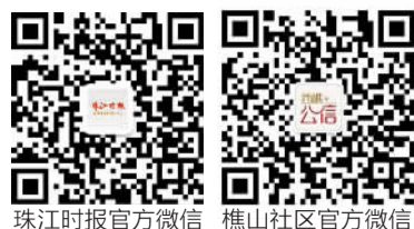
珠江时报官方微信 樵山社区官方微信