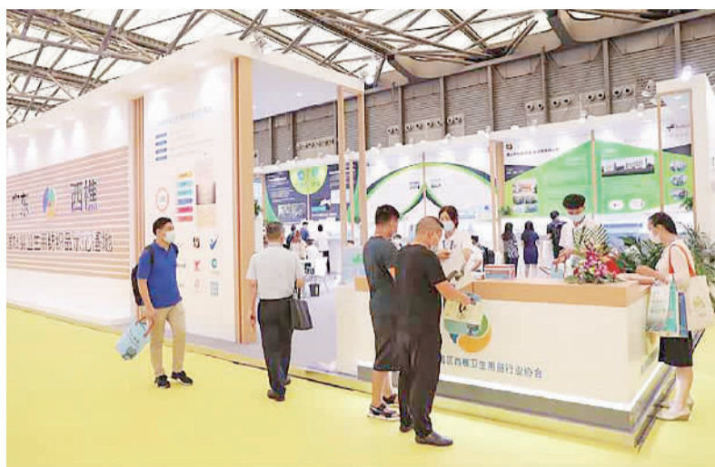
西樵卫生用品产业集群的展位吸引大批客商前来交流采购。

强表示,西樵卫生用品行业已经连续3年以区域产业集群的名义抱团参展,不仅为本土企业搭建推广品牌和产品营销的平台,更进一步擦亮了“中国妇婴卫生用品示范基地”的国字号招牌。