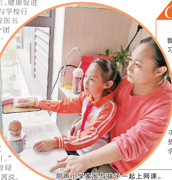
同声小学家长与孩子一起上网课。