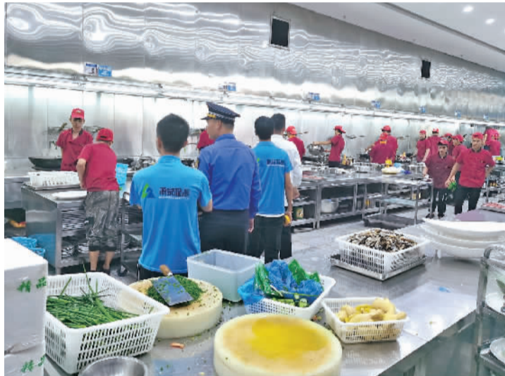
罗村中队联合第三方检测公司对部分大型餐饮企业的油烟排放问题进行突击抽检。

法行为。”关伟军说,接下来罗村中队将加大力度开展建筑工地及渣土运输车辆查处工作。一旦发现违规行为,坚决查处绝不姑息。