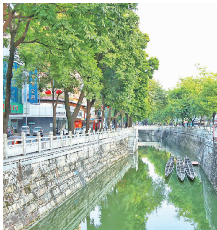
■整治后的九江河涌水清岸绿。

“这份成绩来之不易,是大家精耕细作,协同治理的结果。”九江镇党委委员吴兆强表示,去年九江镇依托河长制全面推进黑臭水体整治,镇级河长巡河696次,村级河长巡河1656次。其中,梅圳大谷涌清淤整治工程自今年3月动工以来,进展顺利,预计于9月完工。另6条市考核河涌以及黑臭水体的非法入河排污口清理整治工作也有望于年中完成,确保年底全面消除城乡黑臭水体。今年还将积极推动海心沙生态修复工作。除了梅圳大谷涌,更多的跨界河涌整治也在加快推进。此前九江镇河长办已召集了九江、西樵和龙江的相关部门,联合整治陈仲涌、英明河涌的跨