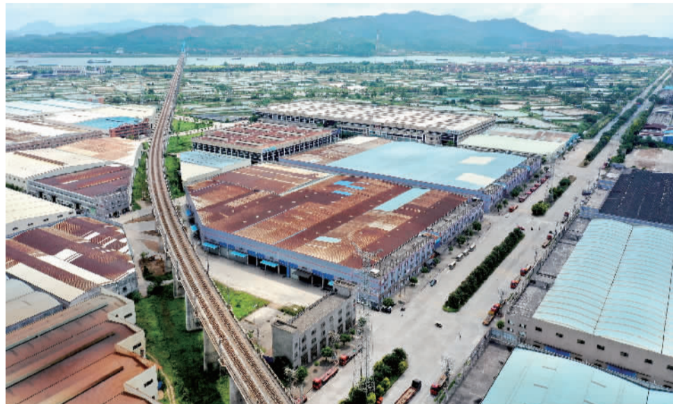
■九江临港国际产业社区是区、镇联动整理和开发的村级工业园升级改造示范项目。

江镇现有村级工业园24个,占地总面积10467.3亩,占全区的5.54%,主要集中在沙龙路和龙高路两旁。根据九江镇2020年村级工业园拆除整理任务进度表,今年九江镇计划完成拆除整理1500亩(截至4月底已完成