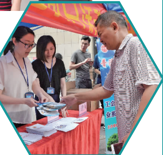
丹灶调解中心多次走进社区开展调解宣传教育活动。