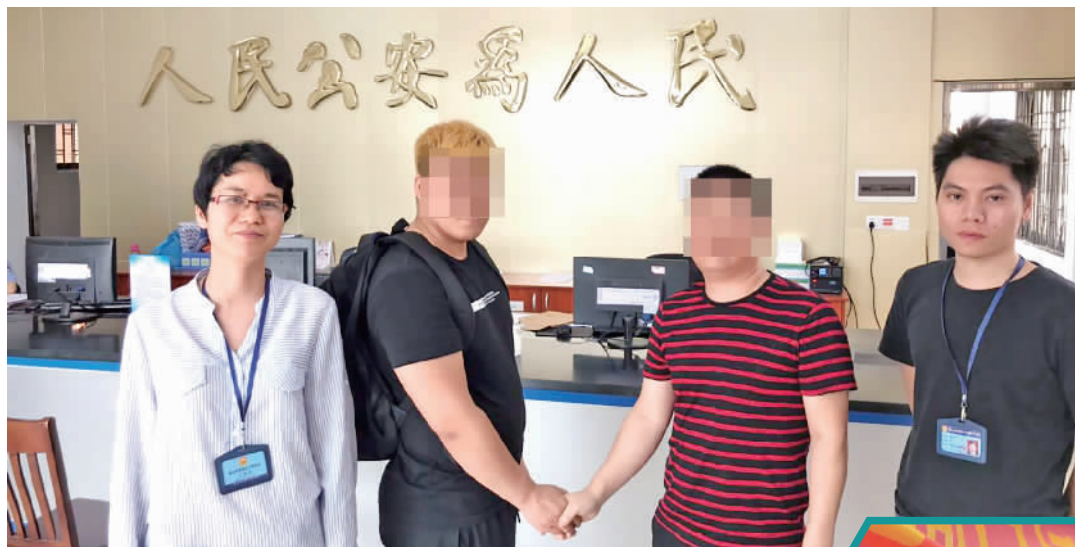
成功调解后,当事人握手言和。

20天调解,5万多元赔偿,当事人双方冰释前嫌。一场由2名老人因菜地通道问题从争执到打架的纠纷案件,最终以人民调解的方式成功划上句号。今年1月,南海区丹灶镇人民调解中心项目(简称调解中心)正式投入服务,聘请专职人民调解员16名,为丹灶全镇提供调解服务,探索构建“小事不出村,大事不出镇,矛盾不上交”群众诉求服务体系,使广大群众的利益诉求得到了第一时间受理、第一时间解决。