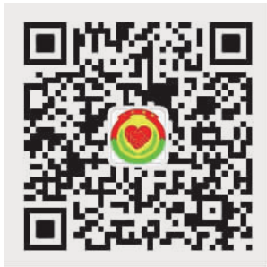
人民调解中心微信公众号 二维码

除了聘请经验丰富的调解员,丹灶调解中心多次走进社区开展调解宣传教育活动,让群众知晓调解这一常态化求助渠道,引导和推动群众优先选择人民调解途径,解决矛盾纠纷,降低信访途径和诉讼途径的工作量,力争做到矛盾纠纷早知道、早干预、早化解。同时,依托“丹灶镇矛盾纠纷调解中心”微信公众号进行线上宣传,普及人民调解的政策法规,宣传调解中心服务,让更多群众知晓相关法规,提升群众法治意识。