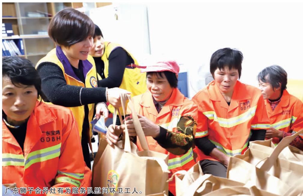
广东狮子会丹灶有为服务队慰问环卫工人。

环卫工人是城市默默付出的“美容师”。近年来,丹灶市政办联合广东狮子会丹灶有为服务队持续专注环卫工人的工作、家庭环境的改善与提升,通过举办环卫工人