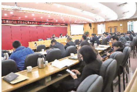
学习《宣传贯彻习近平总书记重要讲话精神 完成好中国工会十七大目标任务》专题讲座。