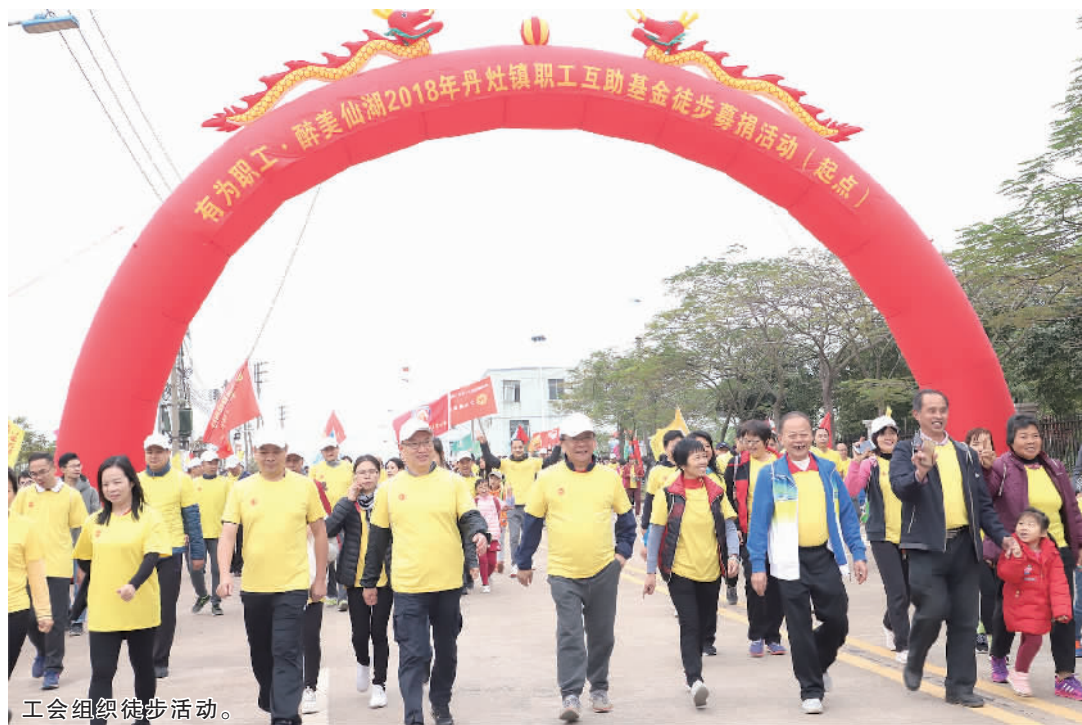
工会组织徒步活动。

各村(社区、园区、行业)工联会主席、镇直属工会主席和社会化专职工会工作者等近60人参加了会议。