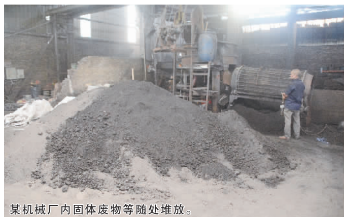
某机械厂内固体废物等随处堆放。