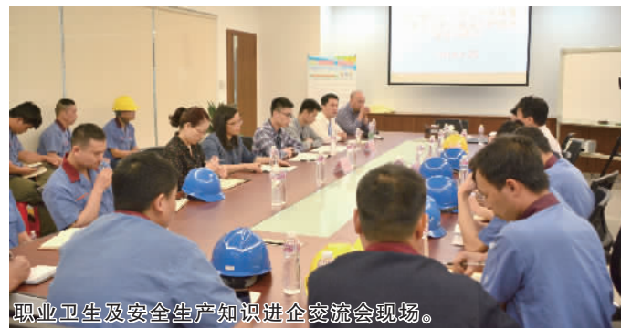
职业卫生及安全生产知识进企交流会现场。

据了解，除了到工业区现场设摊，丹灶镇安监局还通过报纸专版、官方微信公众号等多种形式全面宣传职业病防治法，提高全社会对职业病防治的关注，营造一种政府重视、用人单位和劳动者参与、媒体支持、社会关注的良好氛围，更好地推进丹灶镇的职业病防治工作，更好地保护劳动者健康。