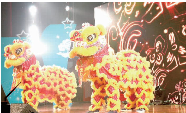
广东西屋康达空调有限公司企业表演队在现场表演醒狮送福。

同时,丹灶镇还将推行一批定制服务,满足产业工人多元化的新需求。通过建立思想教育类、文体艺术类、生活服务类和职场提升类等特色活动和服务菜单,面向产业工人进行定期、定向、定向式的“三定”服务,把宣传思想文化融入产业园区和企业,形成“由企业和员工点菜,宣传部门送餐”的服务格局。