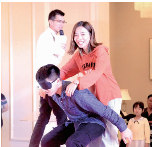
近百名单身男女参加创思驿站举办的联谊活动。