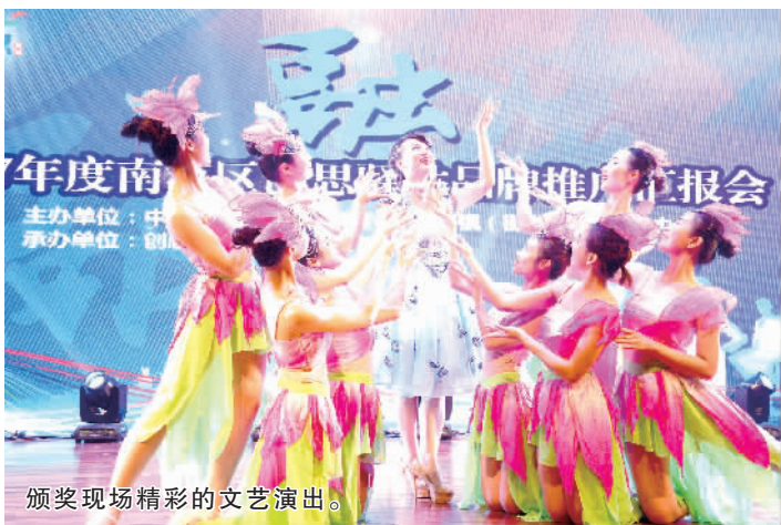
颁奖现场精彩的文艺演出。