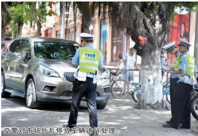
交警对市场外乱停放车辆进行处理。

8月9日上午,丹灶镇市政、交警、城管等多个执法部门联动,对鸿发市场进行全面检查,并对市场内外乱摆放现象进行治理,确保市场环境整洁。