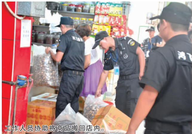
工作人员协助将商品搬回店内。