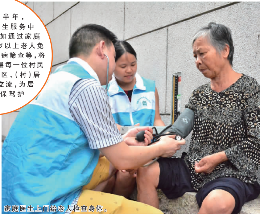
家庭医生上门给老人检查身体。

今年上半年,丹灶镇社区卫生服务中心以多种方式,如通过家庭医生式服务、65岁以上老人免费体检、心血管疾病筛查等,将社卫服务送到基层每一位村民身上,及时与社区、(村)居的村民沟通、交流,为居民的健康“保驾护航”。